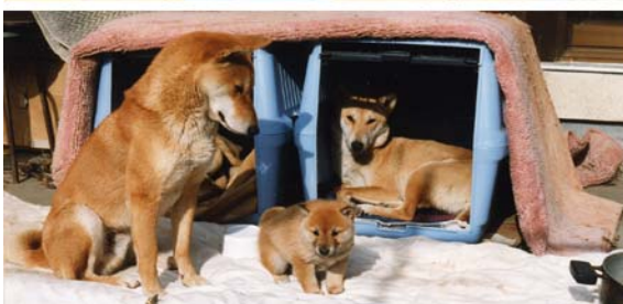
上: 福島の「新美研究室」で暮らすベニとフウ 下: 研究室前で。 夫婦犬で子育て!