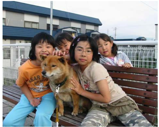
人気者のシバは散歩中に子どもたちと記念撮影。二歳のとき。

前回述べたように、パパとママの家の裏側がわが家の庭に面していて、1.5メートルほどの敷地をへだててわが家の庭に接しているのである。境界には塀も